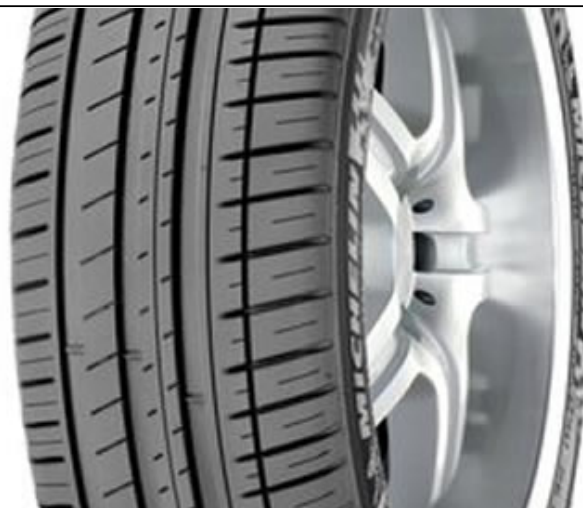
La michelin sport 3 se parece much?simo a la f1 assymetric