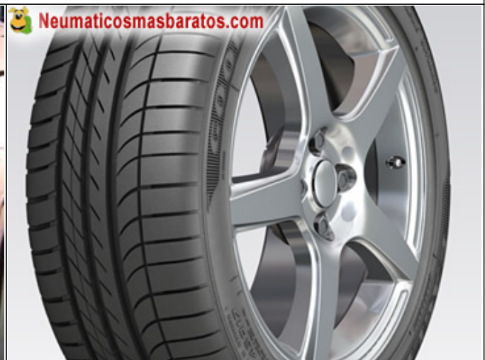
La evoluci del F1 Assymetric