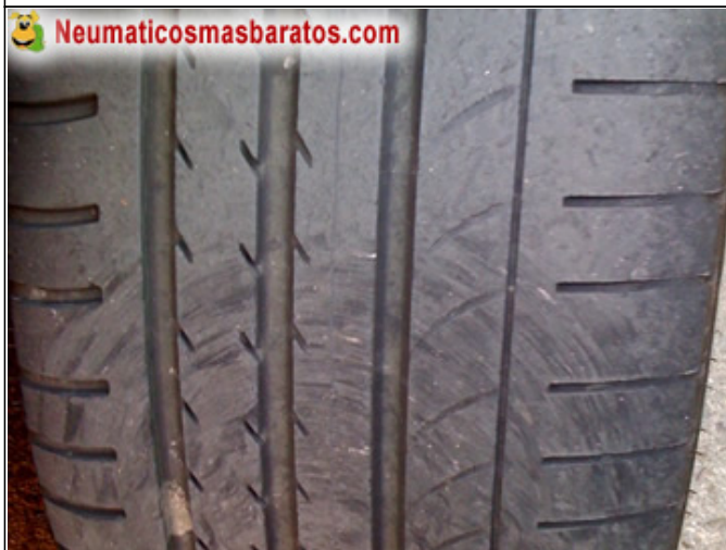
Al 66% de uso la banda hacia fuera se va comiendo perdiendo agarre

Neumico recomendado para personas que buscan las mimas prestaciones y tienen un kilometraje al a bajo-medio.