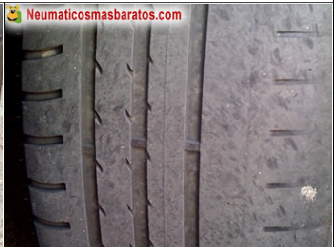
Al 75% de uso, una zona para evacuar agua desaparece, se pierde prestaciones sobre agua y aquaplanning