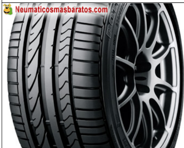
La bridgestone potencia tiene todos los flancos muy marcados

Neumico recomendado para personas que buscan las mimas prestaciones y tienen un kilometraje al a medio. En relaci calidad-precio es de los primeros.